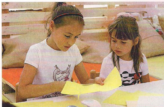
In queste immagini: i ragazzi impegnati nelle attività dei laboratori dell'edizione 2013 di "1, 2, 3...Storie!"